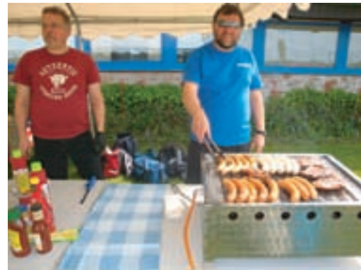
Auch die Männer geben was sie können