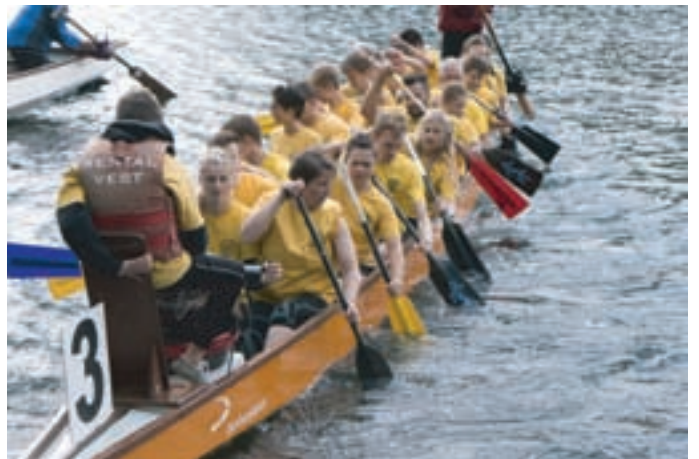
Es war ein erfüllter Tag. Wir freuen uns auf nächstes Jahr und danken den Veranstaltern für das wunderbare Erlebnis.

Am 9.5.2015 veranstaltete der Kanu-Club Homberg die 12. Drachenbootregatta auf dem Toeppeensee in Rheinhausen. Dieses Jahr beteiligte sich die Abteilung Shaolin-Kempo des VfL Repelen mit einer Bootsbesatzung an den Rennen der so genannten Fun-Klasse. Obwohl kaum geübt wurde, gaben die Kempoka wie gewohnt alles und zeigten, dass man auch auf dem Wasser mit starkem Willen vorankommt.