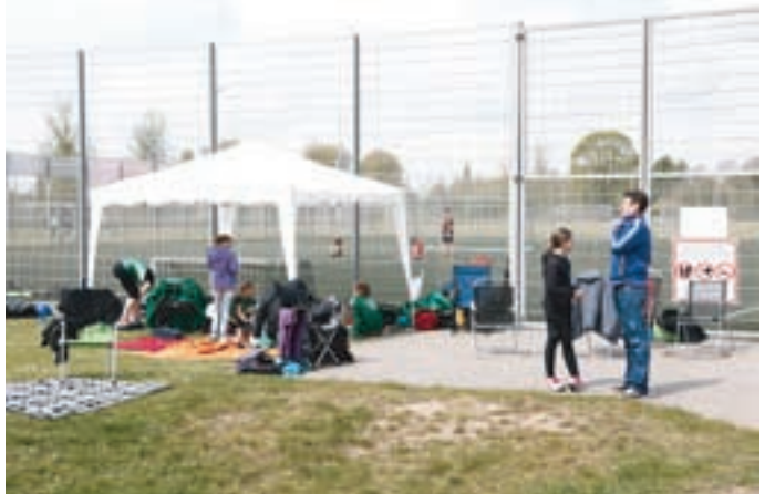
Privates Lager beim Sportfest am 1. Mai 2015