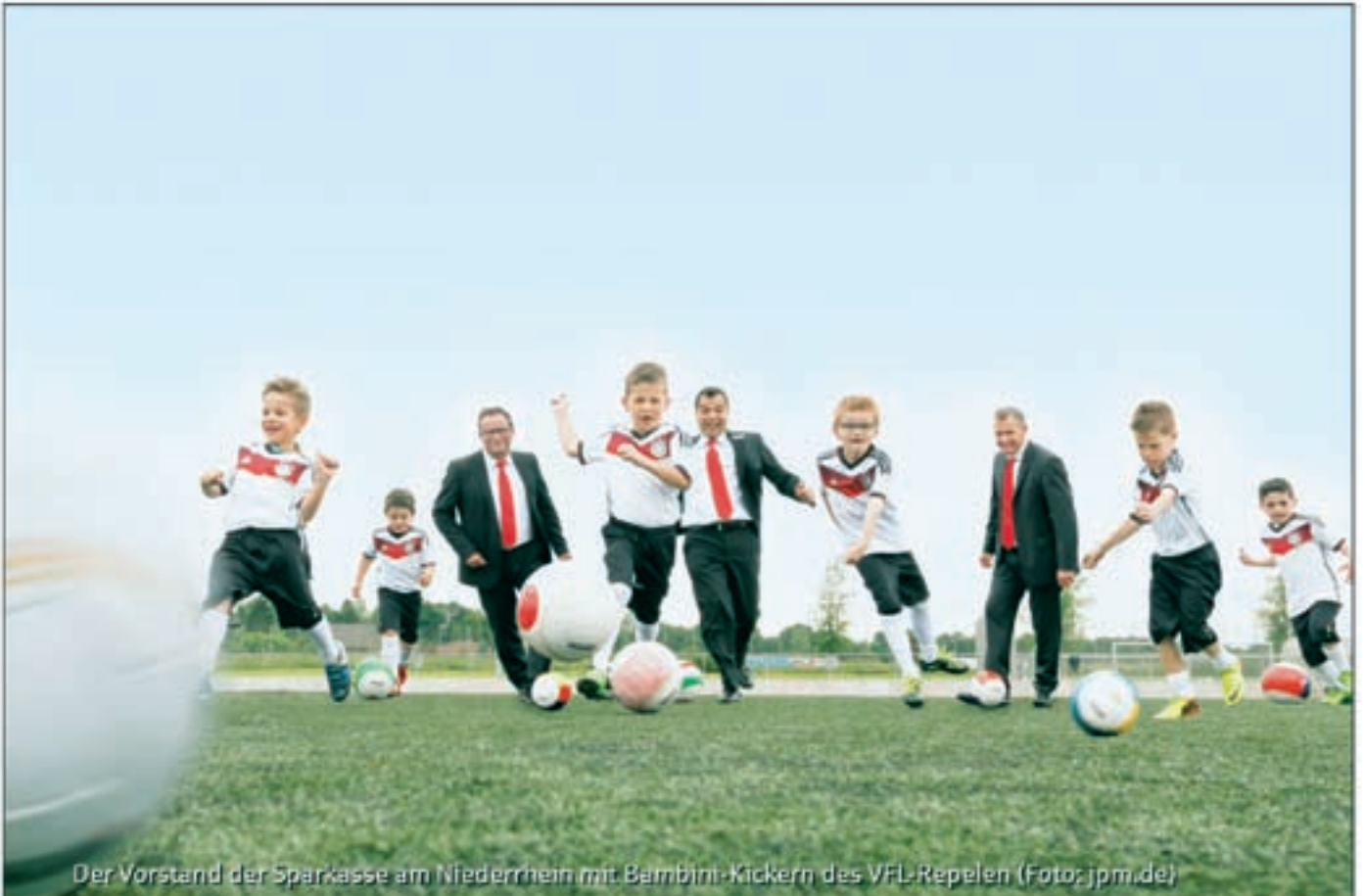
Der Vorstand der Sparkasse am Niederrhein mit Bambini-Kickern des VfL Repelen