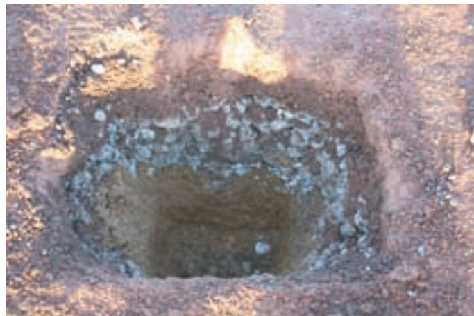
Untersuchungen zur Erkundung des Unterbaus