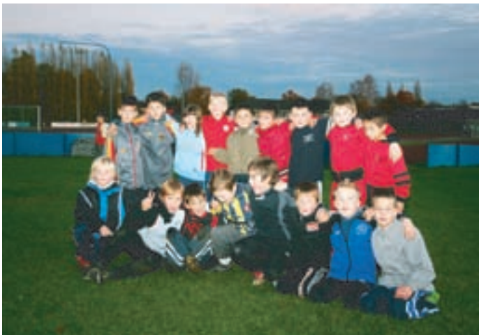
Es macht Freude für die Kinder zu arbeiten