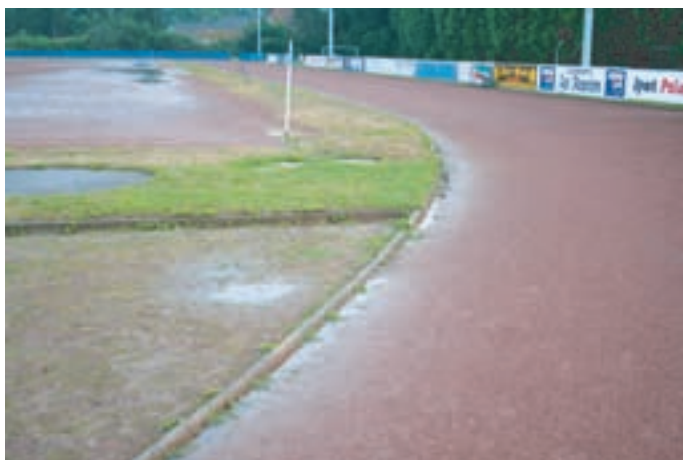
Unser Platz bis 2007