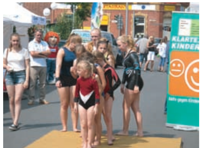
Auch beim Dorffest