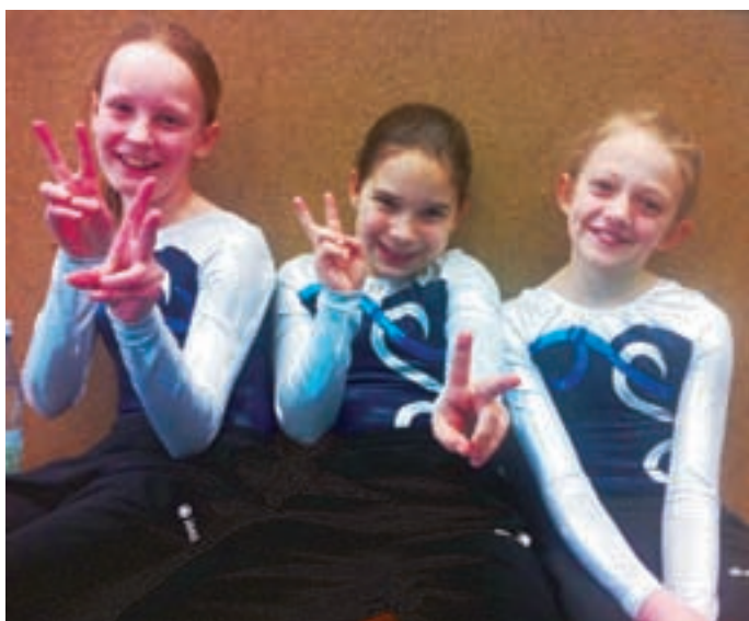
Die „Mittleren“ haben Spaß

In der Mannschaftswertung erreichten die beiden Mannschaften des ältesten und mittleren Jahrgangs einen tollen dritten Rang. Hoffentlich gibt es im nächsten Jahr auch mal wieder eine Repelener Einzelturnerin auf dem Treppchen.