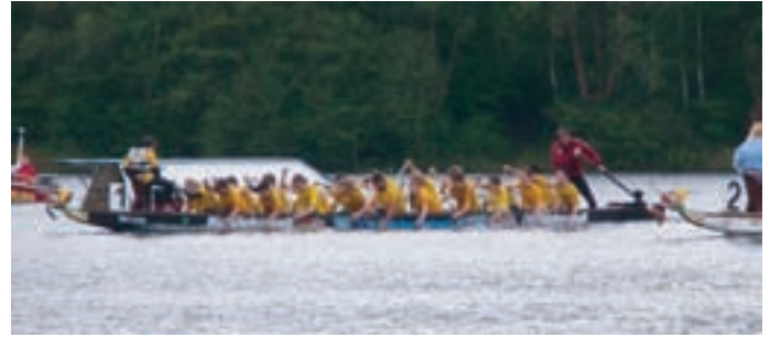
Ein aufregender, ein ereignisreicher Tag