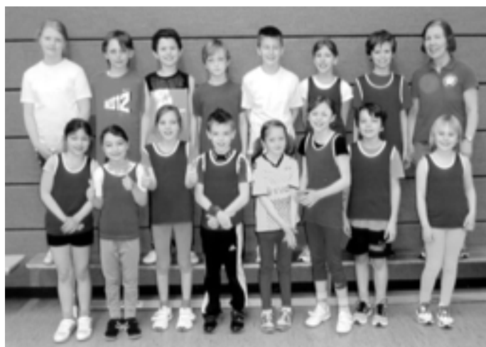
Schüler/innen U 10 und U 12 bei den regionalen Hallenmeisterschaften in Moes