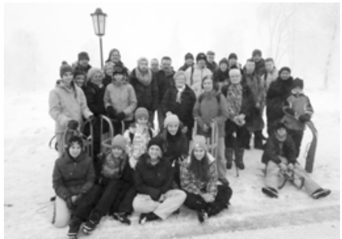
Ein erlebnisreicher Tag im Schnee