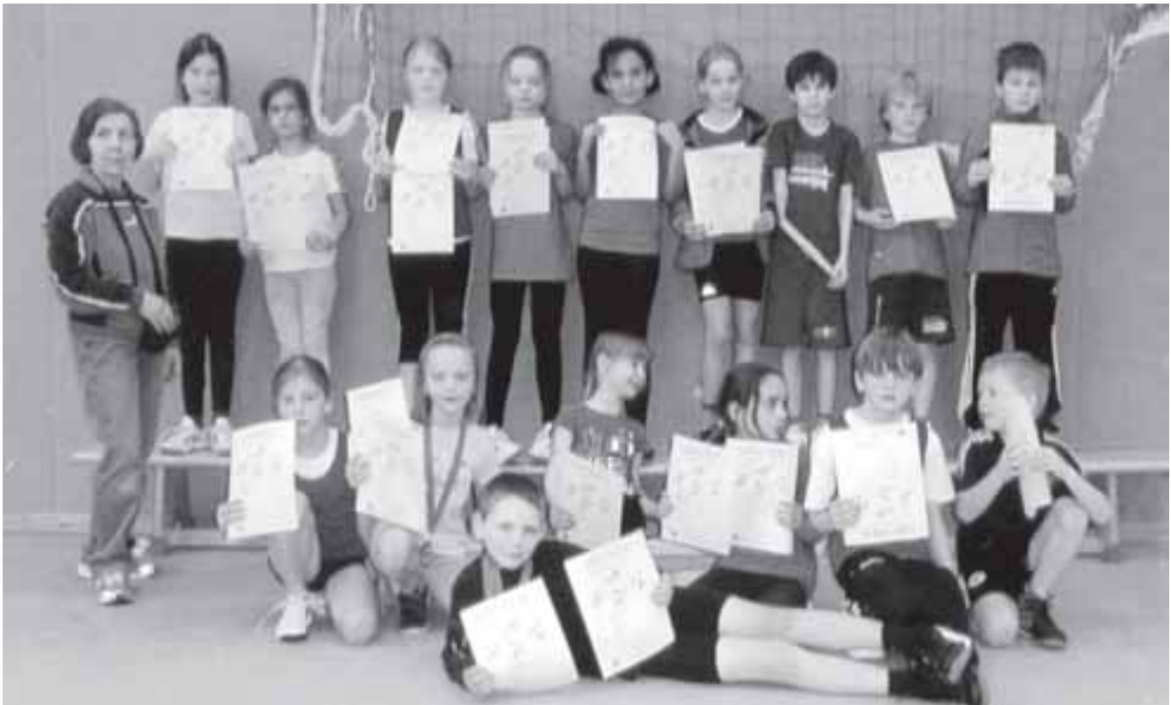
Teilnehmer an den Hallenkreismeisterschaften in Kamp-Lintfort